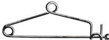
MAYO 29152-14 14 cm