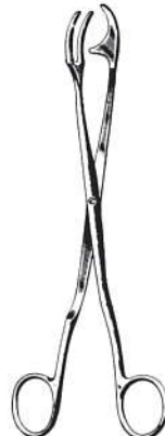
ROGGE 29130-23 23 cm