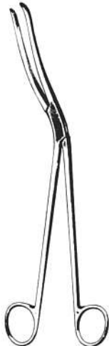
CHEATLE 29110-27 27 cm